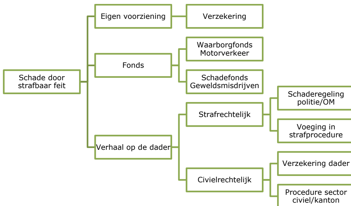
Figuur 1: Routekaart voor schadeverhaal na een strafbaar feit